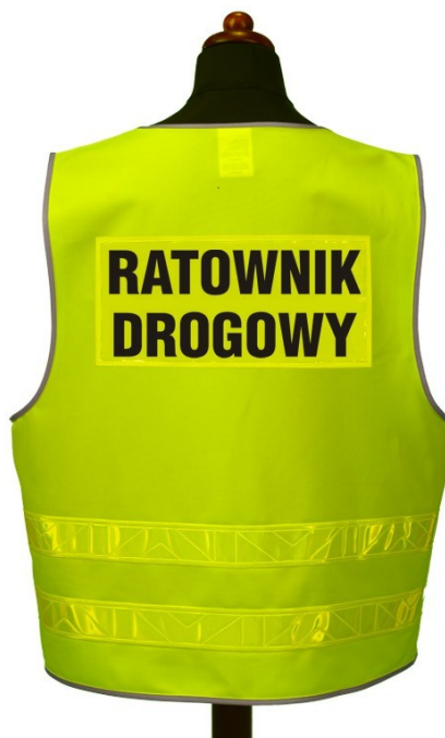
Fot. 2 Kamizelka ostrzegawcza z tyłu – powinna mieć dopisek PZM