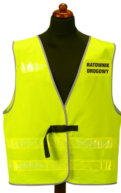
Fot.1 Kamizelka ostrzegawcza z przodu - powinna mieć dopisek PZM

Napis RATOWNIK DROGOWY PZM z tyłu i napis z przodu po lewej stronie piersi RATOWNIK DROGOWY PZM.