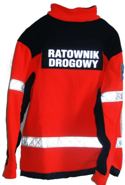
Fot. 4 Polar tył – RATOWNIK DROGOWY PZM