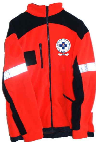
Fot. 3 Polar z przodu

Dopuszcza się stosowanie przez Ratowników Drogowych pod kamizelką odzieży typu „Fluo” z naniesionymi napisami j.w.