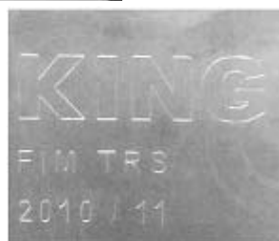
Rysunek nr 4 DEP T10