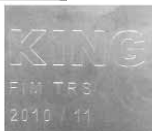
Rysunek nr 4 DEP T10