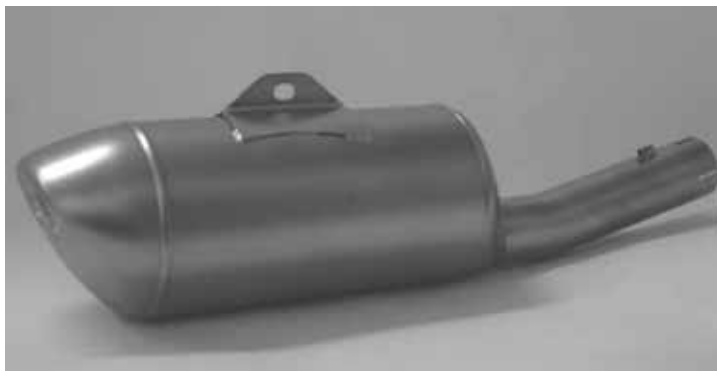
Rysunek nr 1 AKRAPOVIC

Tłumik nie może być perforowany, mieć nacięć, dodatkowych otworów, itp.