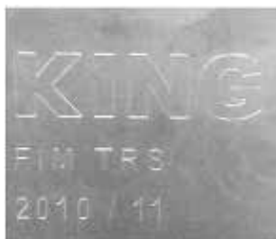
Rysunek nr 4 DEP silencer