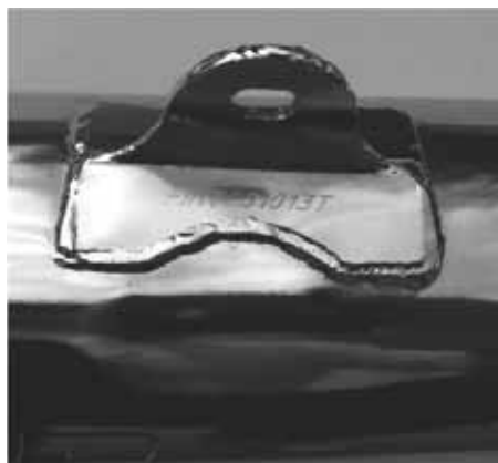
Rysunek nr 5 DEP Pipes - model T10